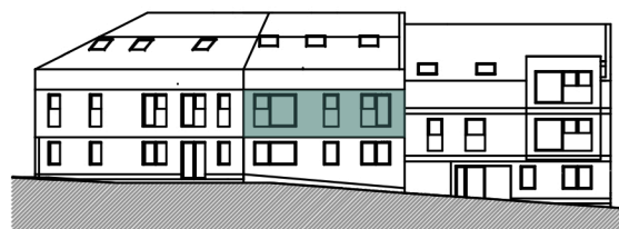
FACADE NOUVELLE VOIRIE