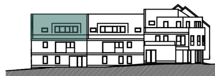
FACADE NOUVELLE VOIRIE